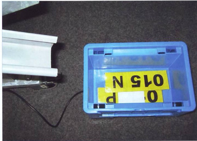
Die eKanban-Karten werden in einem Empfangsbehälter gesammelt (Prinzip Karmann)

in der Automobilindustrie. Unter anderem ermöglicht es eine sekundenschnelle Bedarfsmeldung an die zuständige EDV mit automatischer WLAN-Übertragung an den Materialwirtschaftsrechner und liefert eine vollständige Übersicht durch einen ständigen und zeitnahen Abgleich mit allen vorliegenden Anfragen. Mit dieser Variante spart der Betreiber verschiedene laufende (Personal-)Kosten, weil Such- und Korrekturprozesse verringert und die Erfassung vereinfacht werden. Die Zeiten für eine Information beispielsweise an externe Materialzulieferer lassen sich aufgrund der Datenübertragungstechnik praktisch auf Null reduzieren. Außerdem ermöglicht die neue e-Kanban-Variante eine chargen- bzw. behältergenaue Zuordnung von Material und Fahrzeug, was zum Beispiel eine Identifikation bei Rückrufaktionen deutlich vereinfacht.